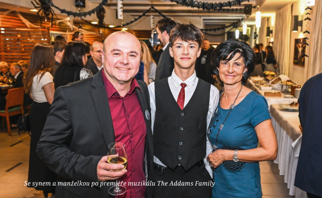
Se synem a manželkou po premiéře muzikálu The Addams Family

Tome, pojďme si zavzpomínat na tvoje začátky.