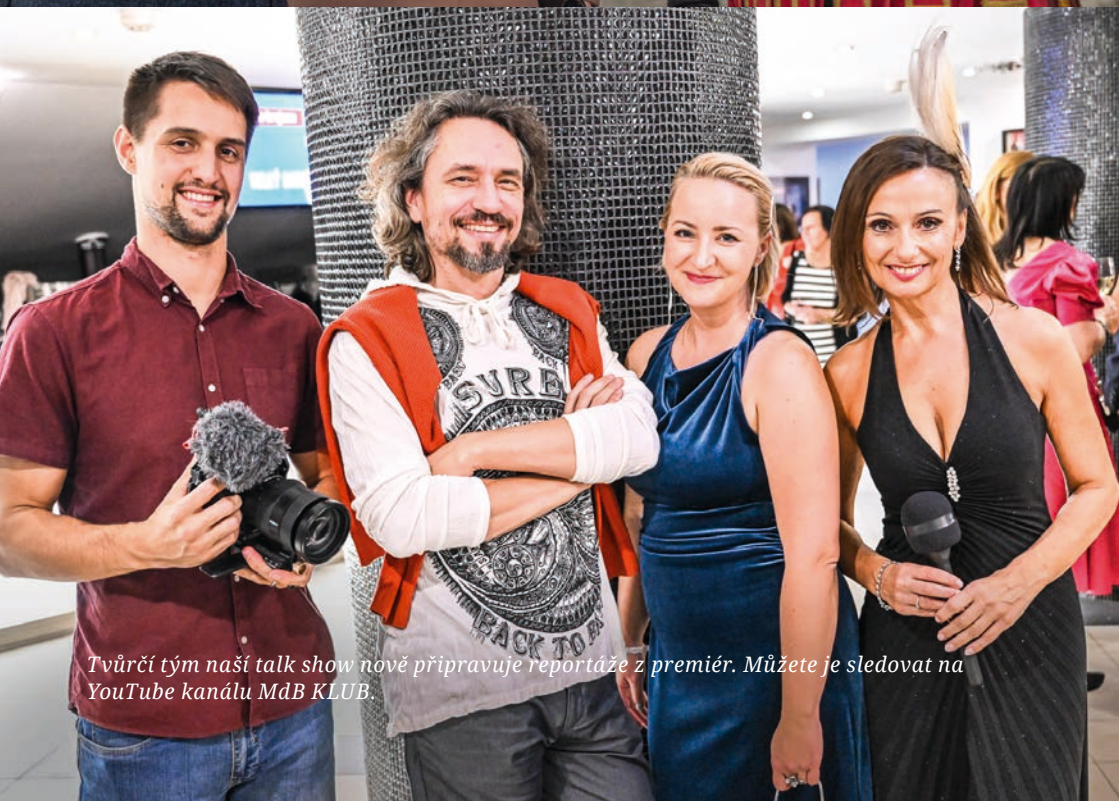
Tvůrčí tým naší talk show nově připravuje reportáže z premiér. Můžete je sledovat na YouTube kanálu MdB KLUB.